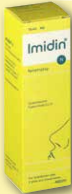
Imidin ® N Nasenspray 15 ml