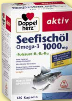
Doppelherz ® aktiv Seefischöl Omega-3 1000 mg