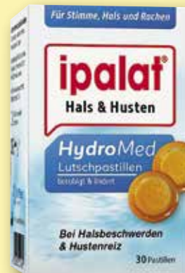
Ipalat ® HydroMed Lutschpastillen