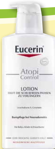
Eucerin ® Atopi Control Lotion