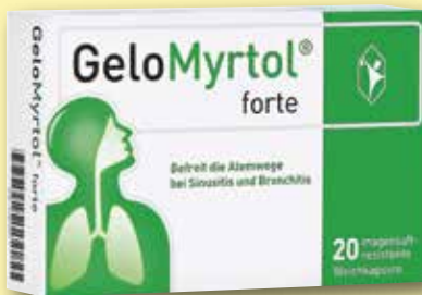
GeloMyrtol ® forte 20 magensaftresistente Weichkapseln