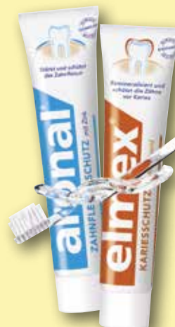
aronal & elmex Doppelschutz- zahnpasta