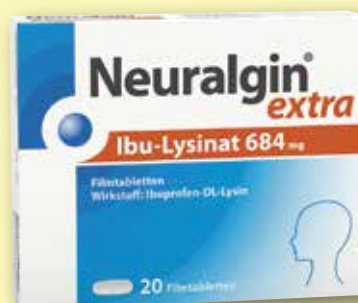
Neuralgin ® extra Ibu-Lysinat 684 mg