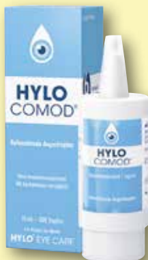
Hylo Comod ® Augentropfen