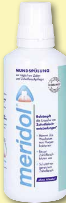
meridol ® Mundspülung