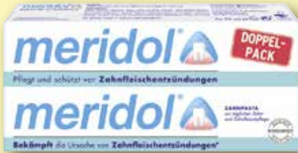
meridol ® Zahnpaste DOPPELPAK