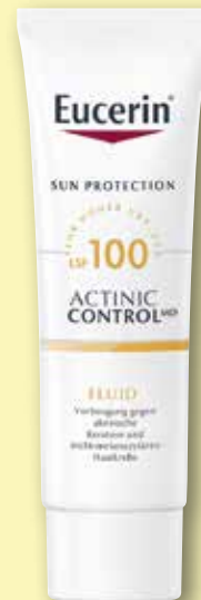
Eucerin ® Sun Actinic Control MD Fluid LSF 100