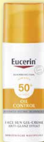
Eucerin ® Sun Oil Control Gel-Creme Anti-Glanzeffekt LSF 50+

Achten Sie auf weitere Angebote in unserer Apotheke!